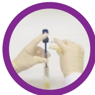
Despeje PDX-LIB no tubo