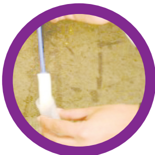
Insira o SWAB no tubo