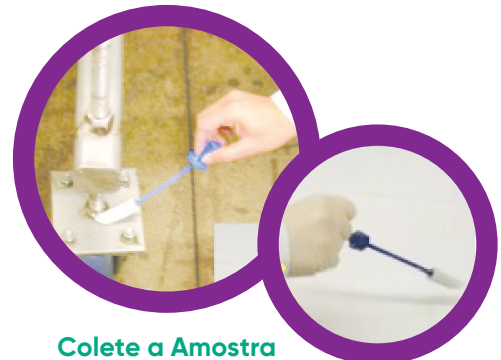
Colete a Amostra