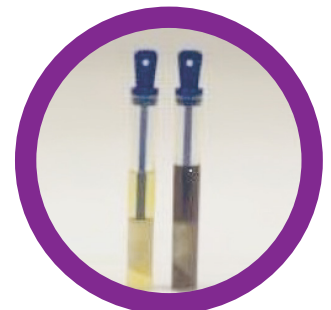
Resultado após 30-48H