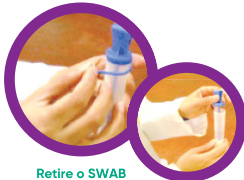
Retire o SWAB